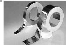
Couvertures thermiques SUR MESURE